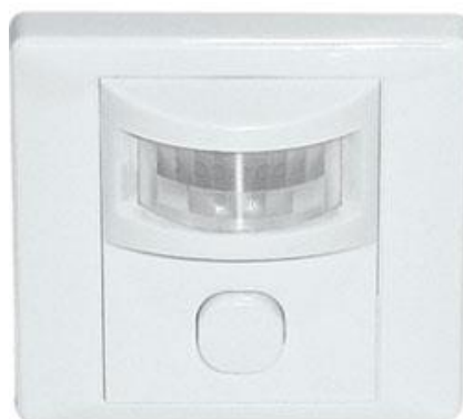
Рис.3 Пример датчика движения с зоной охвата до 16 м

Для этого в местах общего пользования в разрыв электрической цепи устанавливаются датчики движения с зоной охвата до 16 м (рис. 3).